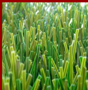
Pasto Monofilamento (Monoslide Pro)