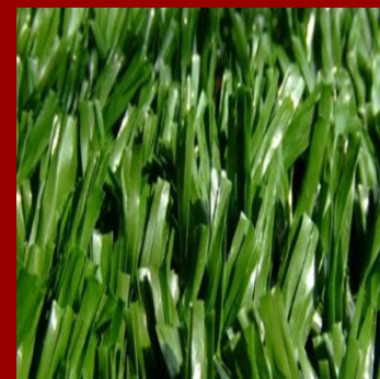
Pasto Fibrilado (TepeslideXP)