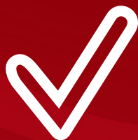
TABLA DE INSTALACIÓN.